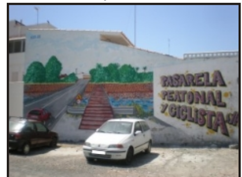
Pintada en el barrio San José con esta petición

■ Cruzar andando o en bicicleta el puente del barrio de San José es una tarea peligrosa. Los vecinos de ese barrio y todos los porteños venimos pidiendo desde no se sabe cuando la construcción de una pasarela para peatones y ciclistas, ya que cualquier día pasará alguna desgracia y será tarde para lamentarlo. La moción presentada en su día por SP ante el pleno fue aprobada pero el ayuntamiento de Sagunto ha dado la callada por respuesta.