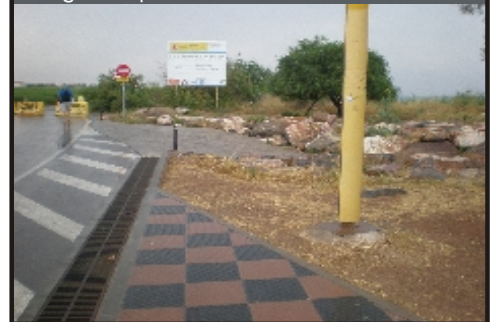
Estado del final de la Avda. Mediterráneo.

EL DATO: actualmente damos una imagen deplorable a nuestros visitantes