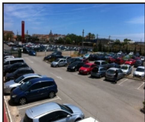
vista del parking de RENFE un día cualquiera