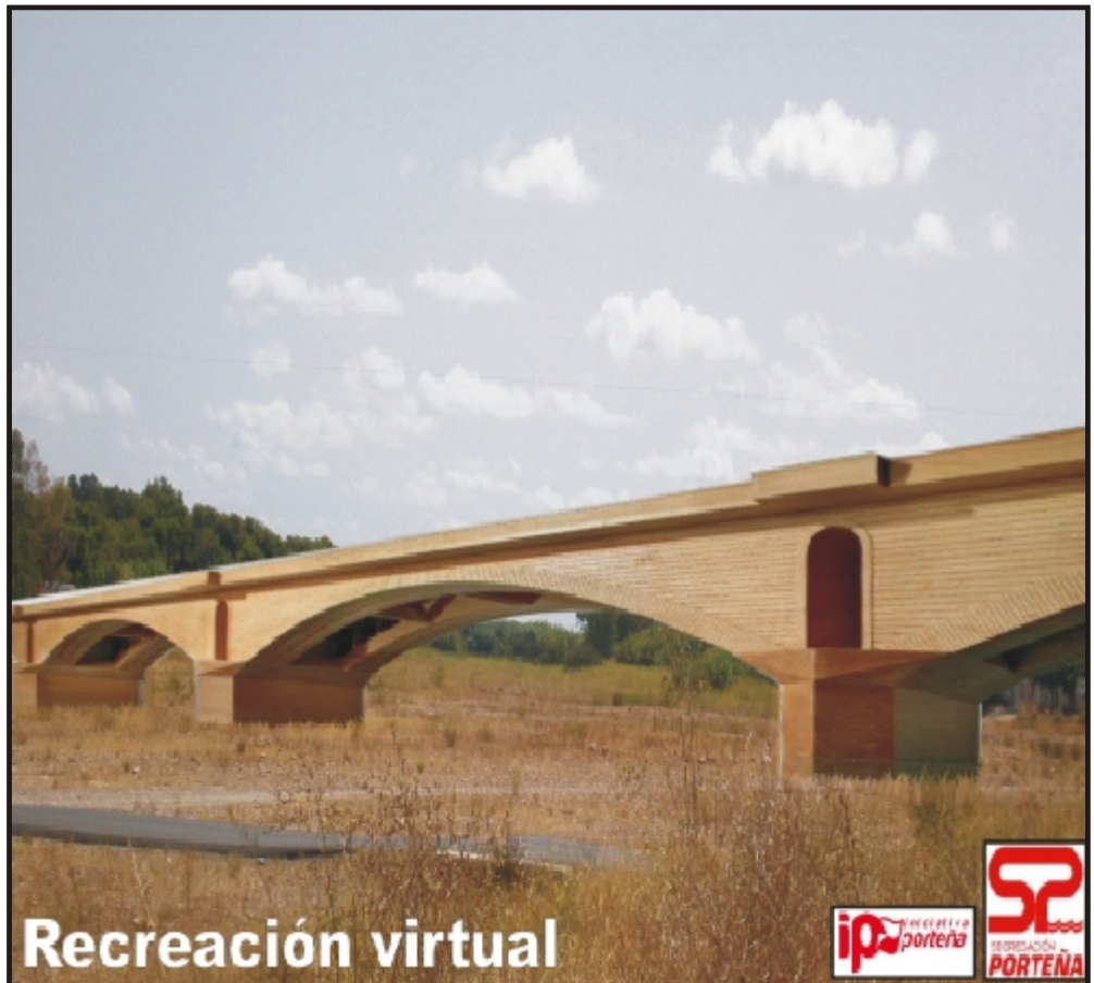
Vista de un nuevo puente que conecta Canet y El Puerto a la altura del delta del río