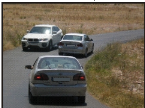
el vado apenas permite el cruce de dos coches

Todos los días cientos de coches hacen su particular rally París-Dakar al cruzar el cauce. Además las señales existentes prohíben la utilización de esta vía básica para El Puerto.