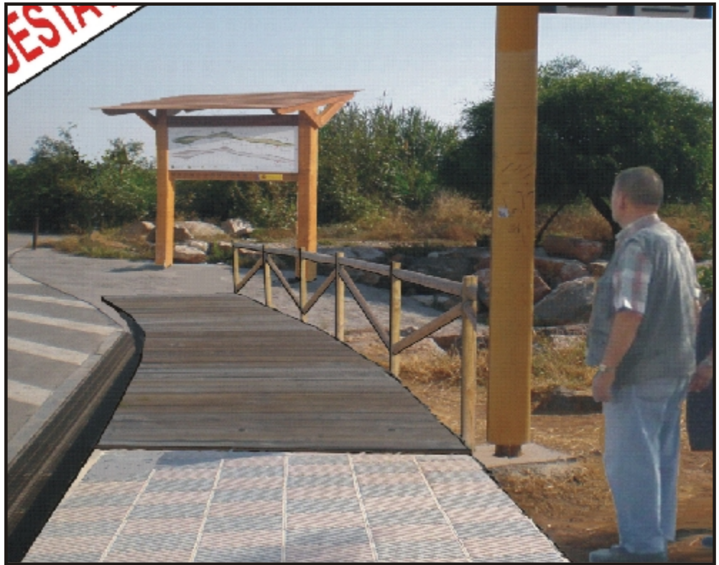
Recreación virtual de la propuesta de IP para una adecuada conexión con el Delta

NOTICIA DE ULTIMA HORA PP Y BLOC TUMBAN LA PROPUESTA el Bloc alega discriminación hacia Sagunto