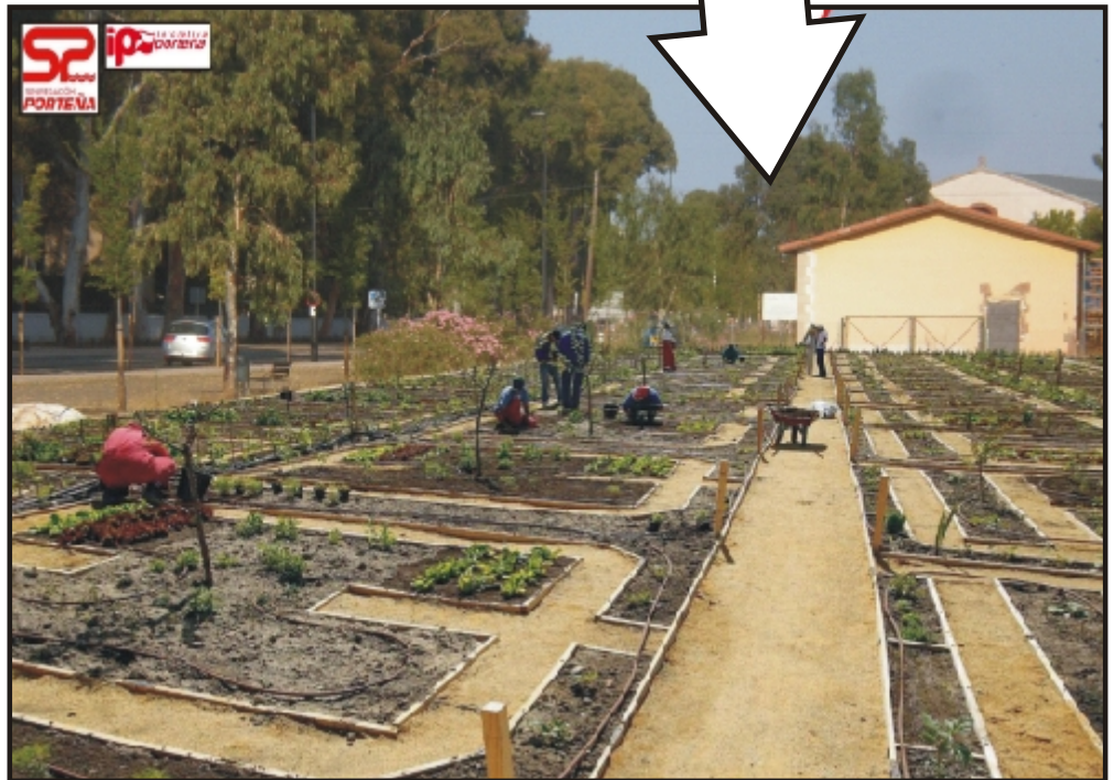
Vista del antes y después de una parcela abandonada y regenerada con huertos urbanos