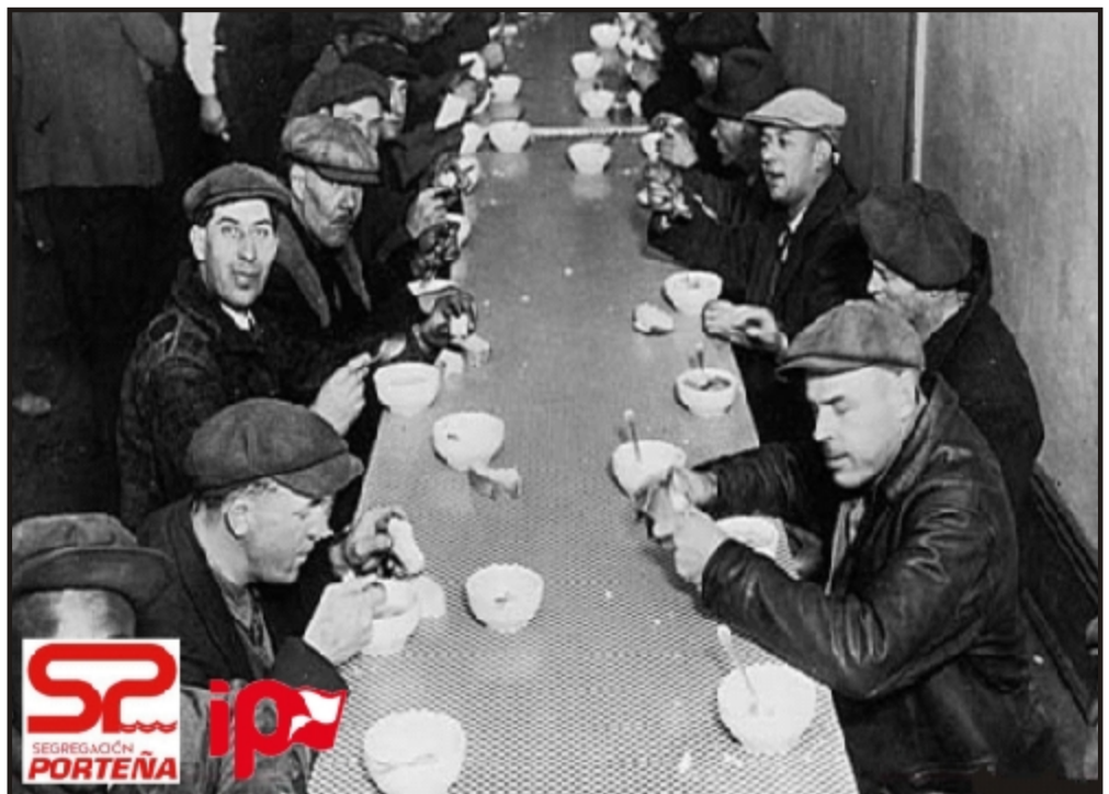
La actual crisis golpea afectando a las necesidades más básicas

■ La actual crisis ha hecho que numerosas familias hayan quedado sin ningún tipo de recursos económicos siquiera para lo más mínimo. El actual comedor social ubicado en Sagunto pensamos que está saturado, además de suponer un trastorno para las personas que deban trasladarse desde El Puerto. Por todo ello hemos llegado a la conclusión que este servicio debe también ser ofrecido en nuestro pueblo. La moción aprobada en el pleno del Ayuntamiento insta a la Generalitat a solucionar esta situación.