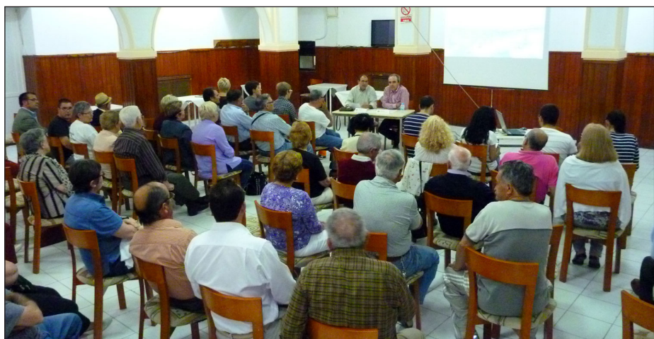
Decenas de personas asistieron ayer a la conferencia ofrecida por Iniciativa Porteña en el Casino RYC