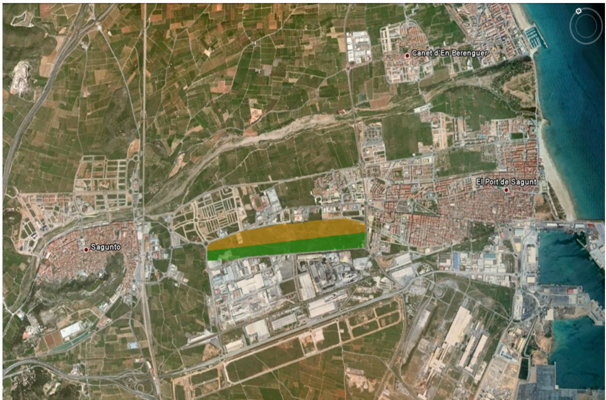
Plano nº 12

Ubicado entre la zona industrial y los diferentes ámbitos de la zona ínter núcleos ( planos nº 12 y 13 ).