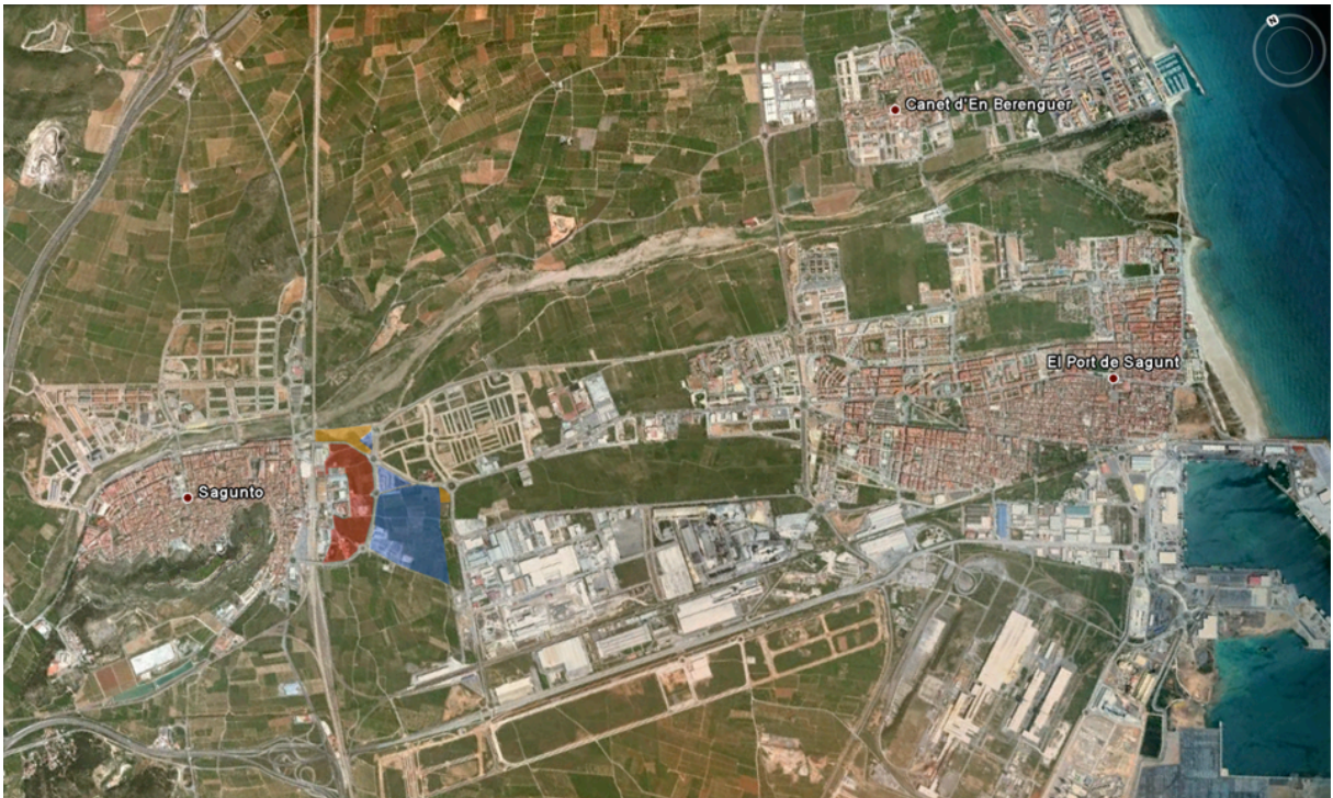
Plano nº 14

conseguir un convenio a tres bandas con el Ministerio de Fomento y la Generalitat Valenciana, para cubrir las vías a su paso por la localidad. Pero de momento, todo son buenas intenciones ya que es muy complicado conseguir la financiación que partiría de una actuación urbanística que con el difícil momento que atraviesa el sector, es sumamente complicada.