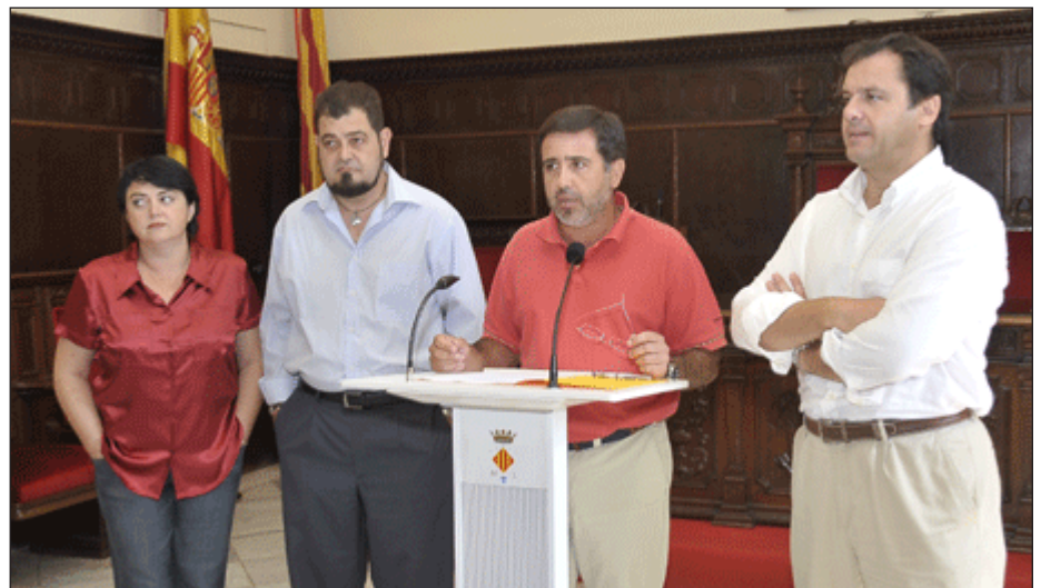
Castelló mintió a SP al incumplir la base del pacto: no entorpecer el proceso de segregación

"Castelló ha gobernado en contra del pueblo que le vio nacer: El Puerto"