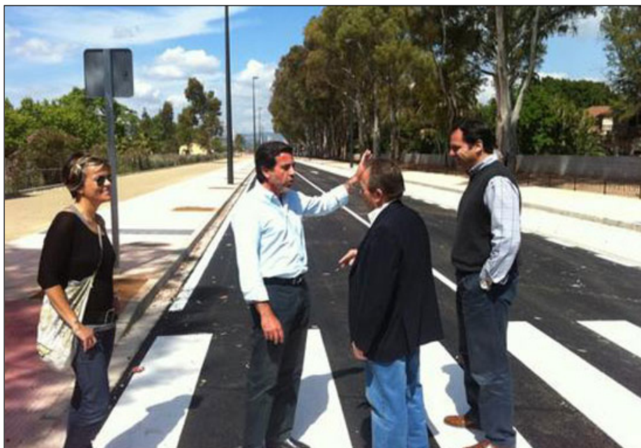
Foto enviada a los medios para publicitar la apertura, es decir, una inauguración en toda regla con la avenida Jerónimo Roure. Esta vía se convertirá en una nueva zona de acceso rápido y fluido desde la zona este de El Puerto hasta la playa.

La prolongación de la avenida 3 de abril hasta Sindicalista Torres Casado era una asignatura pendiente de la movilidad urbana de El Puerto, que ha sido posible mediante la ejecución del Plan de Actuación Integrada del Borde Sur-Gerencia. Con esta infraestructura se conseguirá una mayor permeabilidad del tráfico, con una rotonda en el antiguo acceso a la Fábrica , el conocido como El Paso , en la confluencia